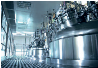
Tank ve silo tartımı