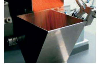
Proses kontrol uygulamaları